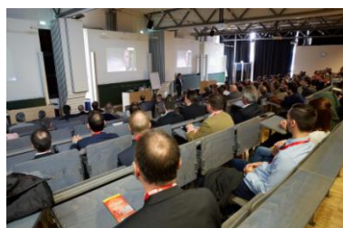
Foto 3: ProFlex 2017: Spannende Fach- und Impulsvorträge im Audimax der Hochschule