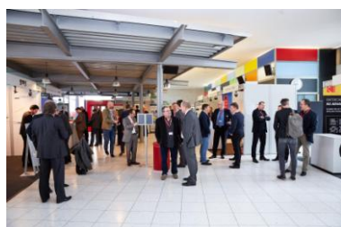
Foto 2: ProFlex 2017: Die attraktive Ausstellung der DFTA-Mitgliedsfirmen bot Gelegenheit zum Austausch und zum Networking