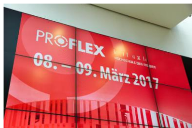
Foto 1: ProFlex 2017: Treffpunkt der Flexo- und Verpackungsbranche in der Hochschule der Medien in Stuttgart

Diese Fotos können unter Angabe der Quelle DFTA Flexodruck Fachverband e.V. im Zusammenhang mit der Berichterstattung verwendet werden: